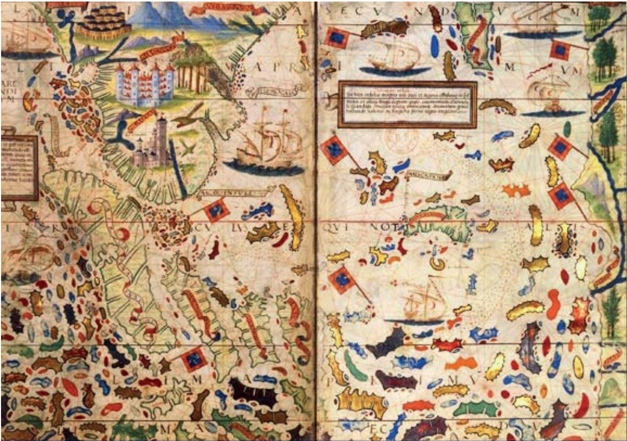
Une des plus anciennes cartes européennes de l'Insulindre et des Moluques Sur le feuillet de droite, sont représentées les Moluques, «les Iles aux Epices».

Les épices étaient réservées aux familles les plus riches car leur acheminement depuis l'Orient nécessitait plusieurs mois de transport maritime ou terrestre, l'acquittement des taxes dans chaque port, sans oublier la menace constante des attaques de pirates et de voleurs. Une fois à Venise, une balle d'épices voyait son prix multiplier par cent : les épices étaient donc plus précieuses que l'or.