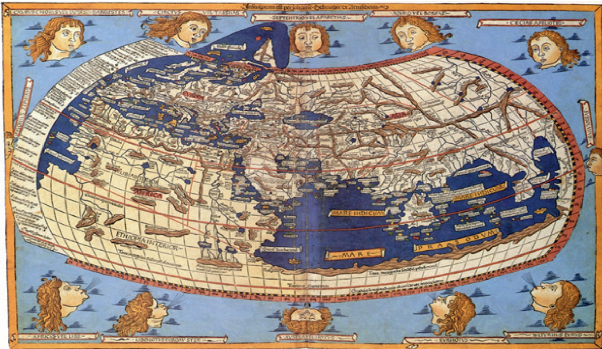
Carte du monde réalisée en 1482 par Nicolas Le Germain

Avant les grandes découvertes, les cartes de l'époque représentent méridiens et parallèles, mais elles contiennent une série d'erreurs qui ne furent corrigées qu'après les grands voyages.