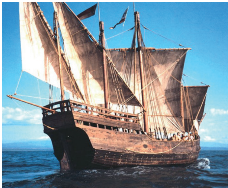
La caravelle est un bateau inventé par les portugais.

A partir de 1519, c'est l'époque de grands voyages autour du monde pour cartographier la Terre. Il reste encore beaucoup de territoires à découvrir. Les navigations sont hasardeuses. Au départ, faute de moyens exacts de mesures, les navigateurs ne peuvent localiser avec précision leurs découvertes. Cette période s'achève en 1843 avec l'exploration de l'Antarctique.